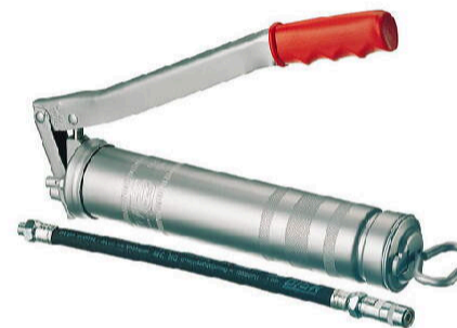
HEBEL-FETTPRESSE E 500 M10X1