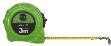
RECA 1-Komponenten-Rollmaßband mit Feststeller 3 m

Produkte, die Ihren Alltag besser machen.