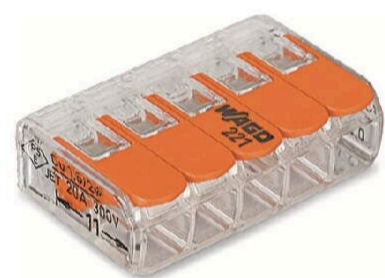
Wago 221 Compact- Verbindungsklemme 5 x 4 mm 2