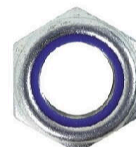
Sechskantmutter mit Klemmteil DIN 985 - I81 - verzinkt blau - M12

Neue Fahrzeugeinrichtung? Da sind wir die Richtigen!